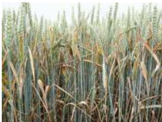
Drifter onbehandeld (Lelystad 2005)

De belangrijkste schimmelziekten die gedurende het seizoen de tarwe kunnen aantasten en schade kunnen veroorzaken zijn bladvlekkenziekten (Septoria tritici en DTR), bruine roest, gele roest, meeldauw en aarfusarium. Niet elk jaar komen deze schimmels in even sterke mate voor; er zijn zieke en gezonde jaren te onderscheiden. Bovendien zijn er grote verschillen tussen rassen; het ene ras wordt duidelijker meer aangetast dan het andere ras (zie foto's hieronder en tabel 1).