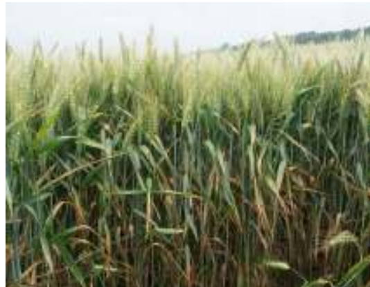
Bristol onbehandeld (Lelystad 2005)

Deze flyer is een onderdeel van het project 'Standaard spuiten maakt plaats voor kritisch benaderen van ziektebestrijding in wintertarwe'. In dit project werken DLV Plant en PPO nauw samen. Het project wordt gefinancierd door het ministerie van Landbouw, Natuur en Voedselkwaliteit en de Europese Unie, DLV Plant en PPO. Het gebruikte onderzoek wat aan de basis staat van deze informatie is gefinancierd door het Productschap Akkerbouw.